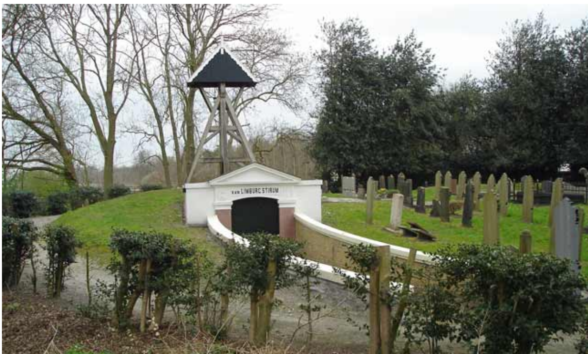
Begraafplaats van Brongergea, einde van de "Tsjerkepaedwandeling".