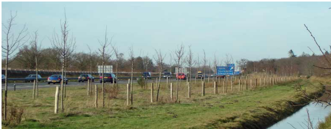
Hier ontbreken geluidsschermen aan de A32