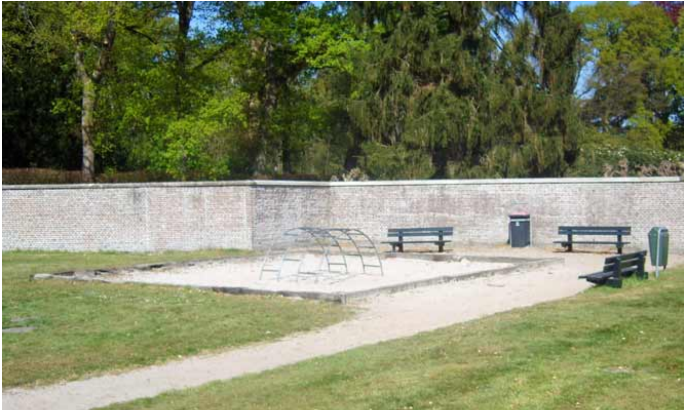
Speeltuintje in de Overtuin