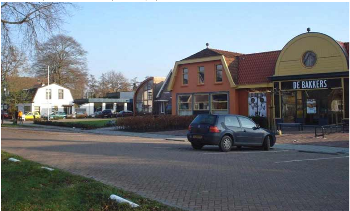
Bedrijven in Oranjewoud