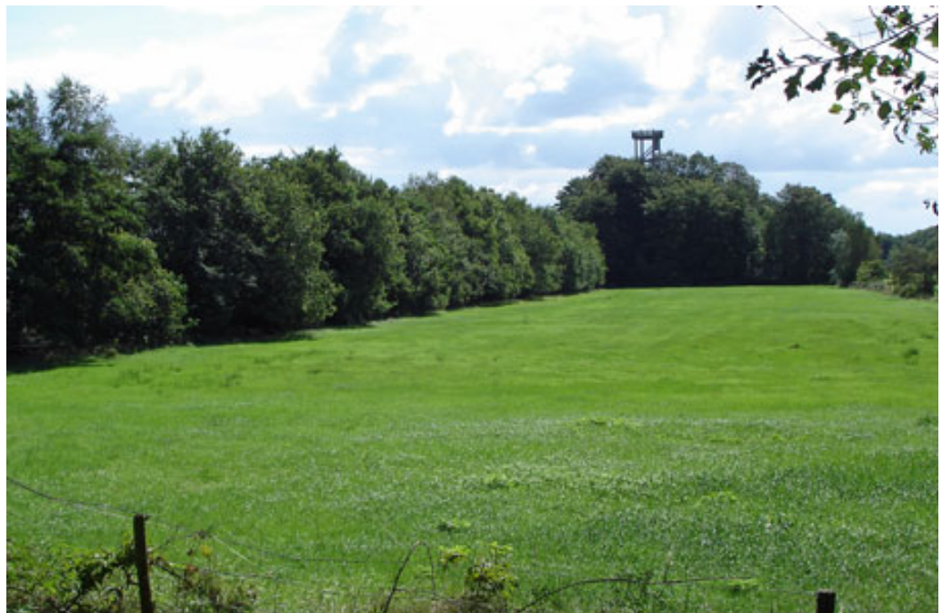
Wissellandschap met houtwallen

Bij het uitwerken hebben we ons toegelegd op het maken van een inventarisatie van waardevolle en/of karakteristieke gebieden objecten / (natuur) elementen. Tot nu toe zijn 72 aandachtspunten geïnventariseerd en voorzien van een korte kenschets.