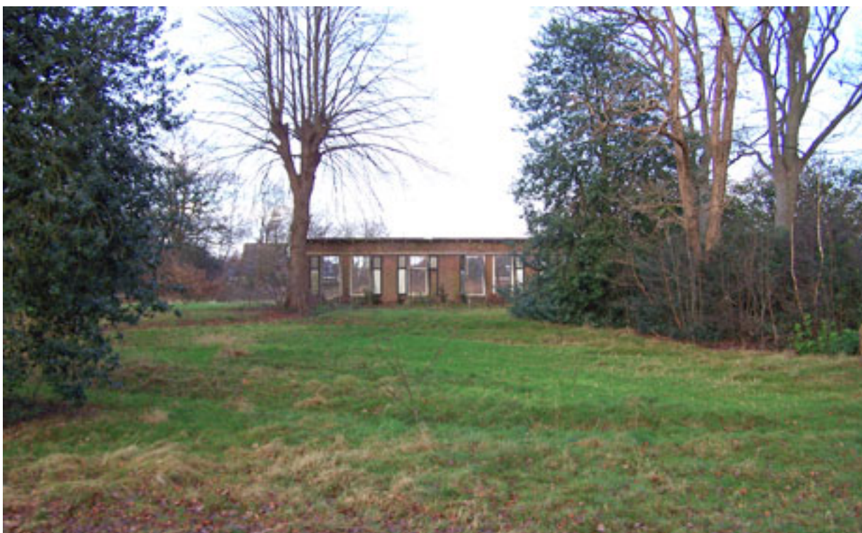
Onze nieuwe centrale ontmoetingsplek in Oranjewoud ??? Ruimte voor een gezellig plein is aanwezig!