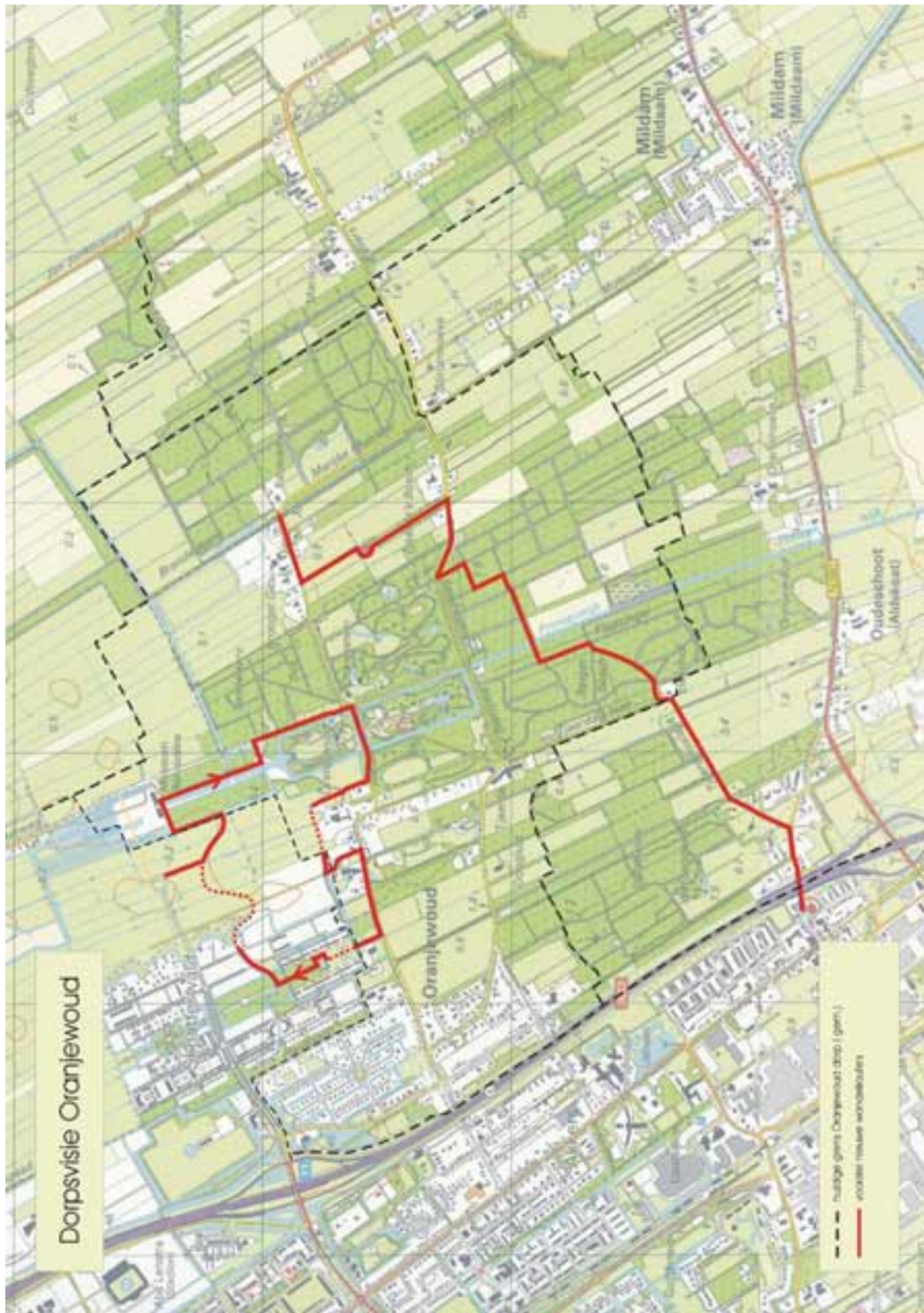
Twee nieuwe wandelingen door Oranjewoud en haar bossen: 1. "Bûtenpleatsenkuierke" en 2. Een "Tsjerkepaedwandeling"