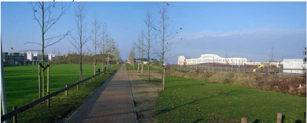
De oprukkende nieuwbouw van Skoatterwâld