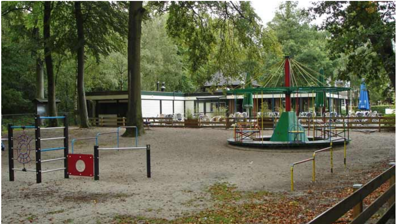
Het speeltuintje bij hotel Tjaarda

Vanuit de werkgroep ‘Wonen’ worden in verband met de specifieke samenhang tussen wonen en de karakteristieke kwaliteiten van het dorpsleven in Oranjewoud, een aantal specifieke voorzieningen genoemd die aandacht nodig heeft.