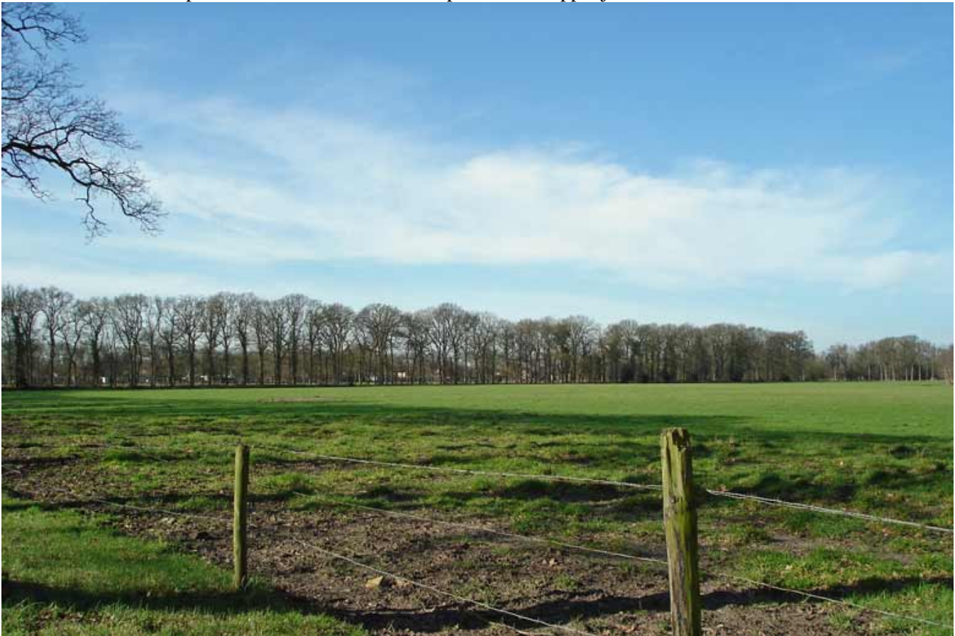
Afwisseling tussen bossen en weilanden