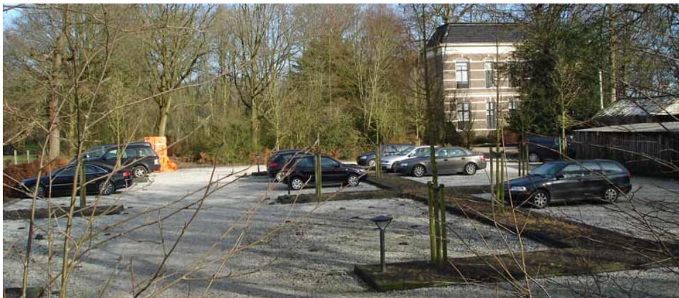
Parkeerterrein aan de Schoterlandseweg