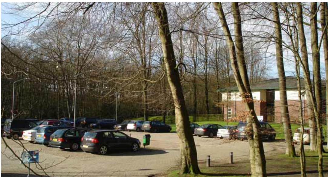
Parkeerplaats bij hotel Tjaarda.

3.3.13 Verbeteren van de bewegwijzering naar Tjaarda en museum Belvédère.