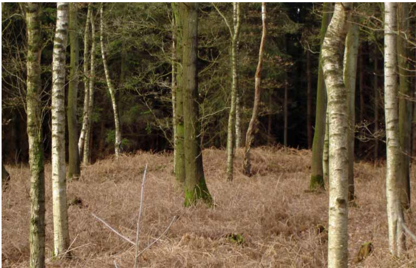
Verborgen grafkelder bij Pauwenburg