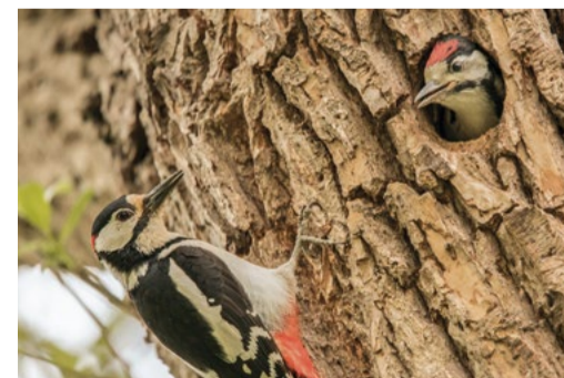
Grote bonte spechten.

We gaan de bossen van Oranjewoud omvormen naar een meer toekomstbestendig bos. Dit gaan we in verschillende fases doen waarin de snelheid van omvorming afhangt van de vitaliteit van de bomen. De eerste fase start vanaf half juli 2023. De volgende fases van omvorming worden verspreid over de jaren waardoor je het huidige bosklimaat behoudt en uiteindelijk meer variatie en structuur krijgt. Bezoekers kunnen hinder ondervinden van de boswerkzaamheden door werkverkeer en tijdelijk minder begaanbare paden.