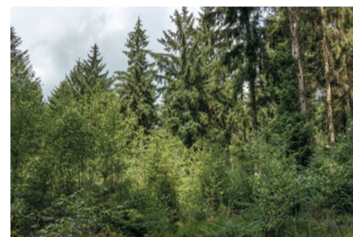
Bos met variatie en structuur.

je uiteindelijk een gevarieerder bos krijgt. Het bos zal veerkrachtig genoeg zijn, beter bestand tegen klimaatverandering en het wordt een thuis voor meer verschillende planten en diersoorten.